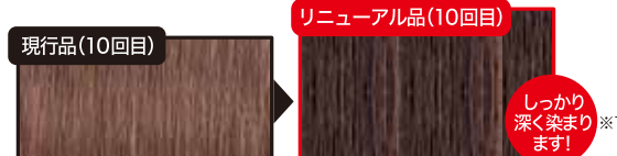
※人毛ヘアパーツによる自社実験。髪質などによって仕上がりに個人差がございます。(ダークブラウン使用)

シリーズ史上初 ※2 「カラーブースト処方」採用 染毛力 ※1 149%アップ! ※3